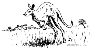
Кенгуру (Австралийская область)

Рассмотрите рисунок с изображением животных, обитающих на разных материках, и определите, (А) какие виды изображены, (Б) какую группу доказательств эволюции они иллюстрируют и (В) тип изоляции, который привел к формированию таких видов.